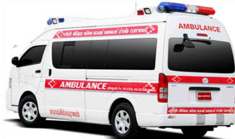
รถพยาบาล