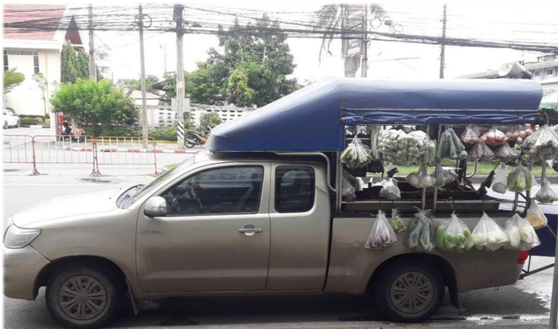
รถขายกับข้าว