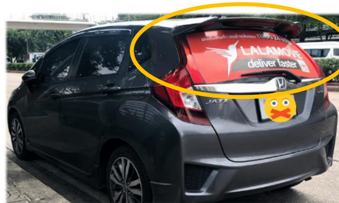
ติดสติ๊กเกอร์ใช้ เพื่อการโฆษณา