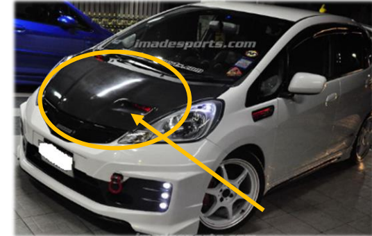
รถดัดแปลง(เจาะฝากระโปรง)