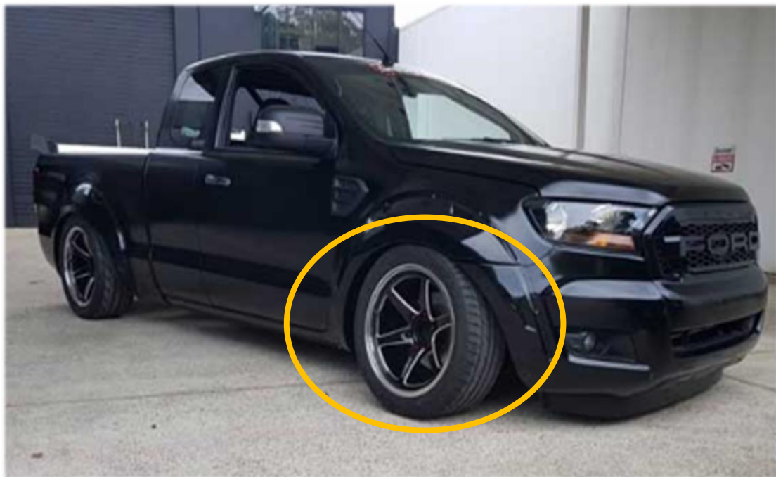
รถโหลดเตี้ย