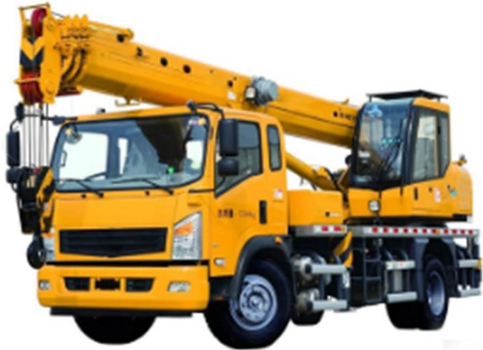
รถเครนใหญ่