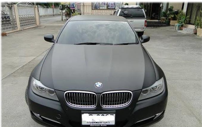
สติ๊กเกอร์สีทั้งคัน หรือ Wrap บางจุด (Wrap car)