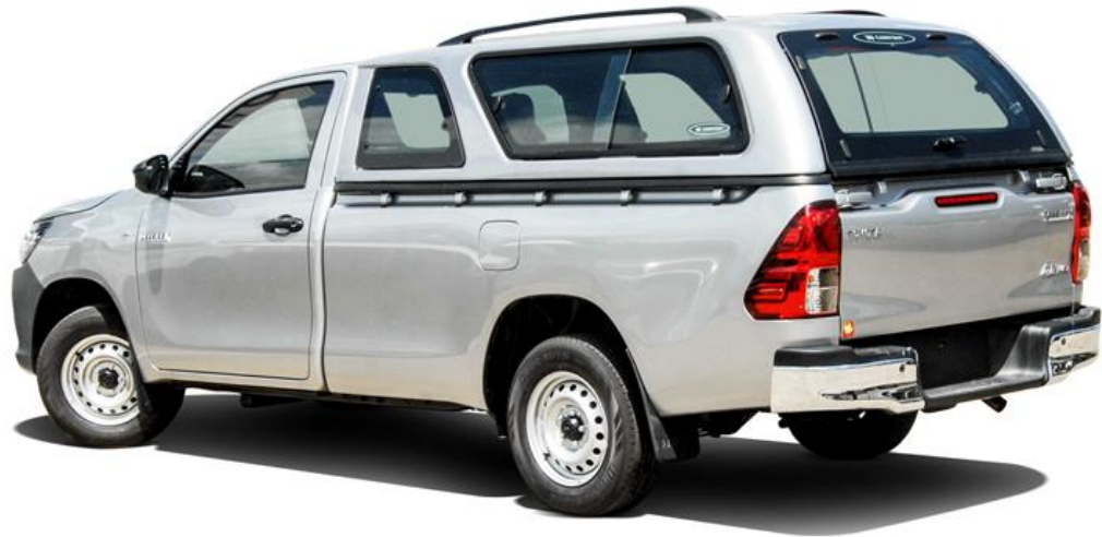
กระบะไม่มีแคป