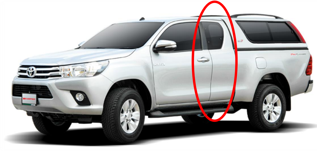
กระบะมีแคป