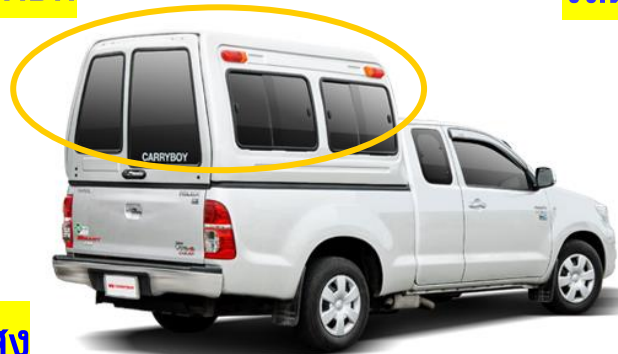
รถแครีบอยสูง