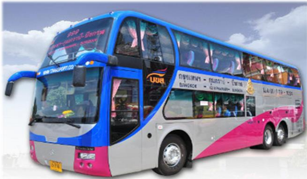
รถทัวร์ บขส.