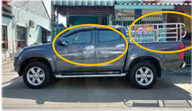
กระบะ 4 ประตูติดคอก