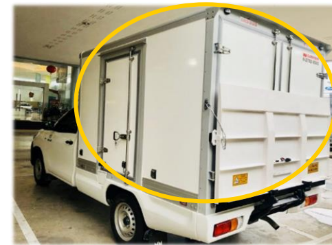
ติดตั้งตู้แห้ง,ตู้เย็นและ มีการดัดแปลงท้ายกระบะ เช่น มีอุปกรณ์ฝาท้ายไฮดรอลิค

กรณีรถตามภาพข้างต้น ไม่สามารถใช้เบี้ยในระบบได้