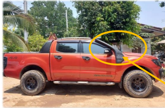
รถติดท่องวงข้าง